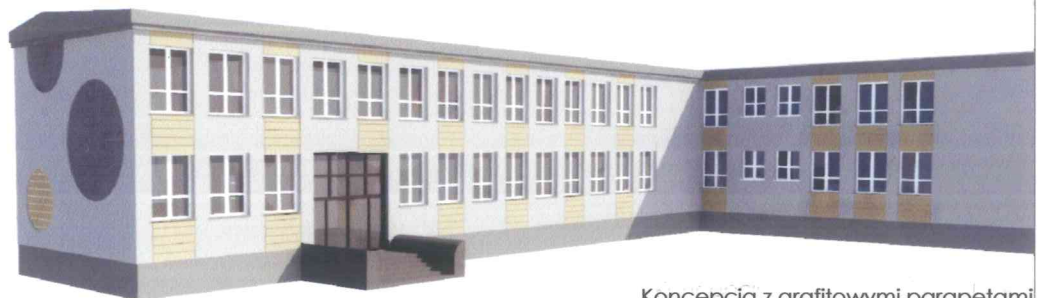
Koncepcja z grafitowymi parapetami