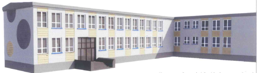
Koncepcja z niebieskimi parapetami