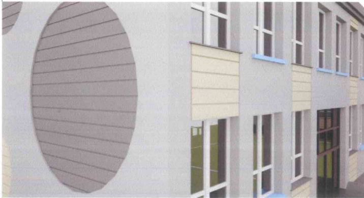
Koncepcja z niebieskimi parapetami